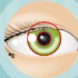
Contrôle par l'iris