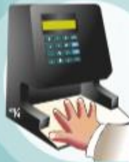
Lecteur biométrique de la main