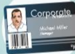
Contrôle par badge