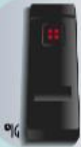
Contrôle par carte