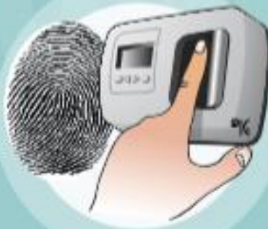
Lecteur biométrique de l'empreinte