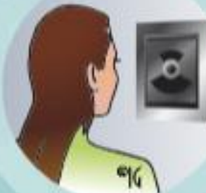
Lecteur biométrique rétinien