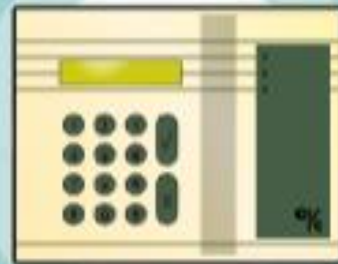
Contrôle par code